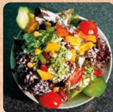
Beilagensalat side salad 5