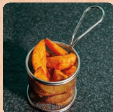
Kartoffelecken potato wedges 4.5