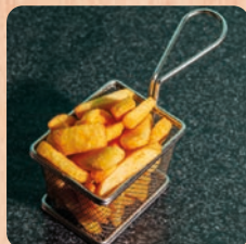
Steakhouse Pommes steakhouse fries 4.5