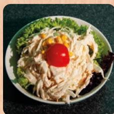
Krautsalat homemade coleslaw 4.5