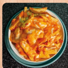
Pommes mit Käse überbacken loaded cheese fries 5.5