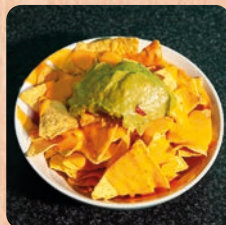
Nachos mit Käse überbacken cheese nachos 5