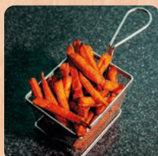
Süßkartoffel Pommes sweet potato fries 4.5